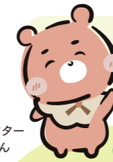
公式キャラクター すくたまちゃん